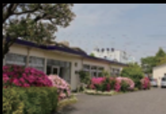
「大倉陶園本社工場」

ザ・カハラ・ホテル&リゾート横浜では、大倉陶園の本社工場を訪れ、ご宿泊されたお客様にのみお楽しみいただける特別な機会を用意いたしました。大倉陶園社員のアテンドにより、世界でも類を見ない技法により高品質の磁器が生み出される様子をご見学いただいた後、一般公開していない展示室で迎賓館やサミット会場などに収められた名品の数々をご観賞いただけます。そして最後に美術品のようなティーカップでコーヒーを味わう至福のひと時をお楽しみいただけます。さらに、記念として大倉陶園選りすぐりの小皿をお持ち帰りいただける、格別な体験をぜひお楽しみください。